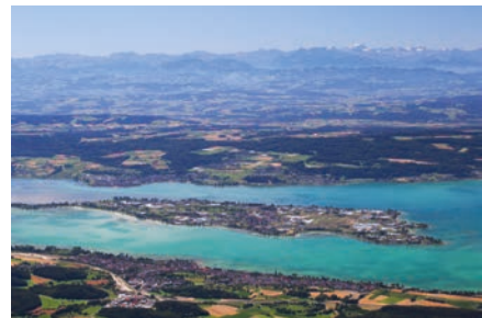
Luftbild der Insel Reichenau von Norden.