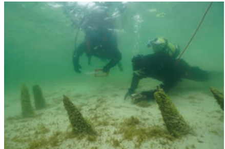
Dokumentationsarbeiten an der unter Wasser konservierten mittelalterlichen Pfahlreihe vor der Reichenau.