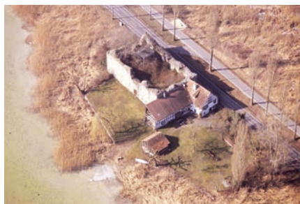
Luftbild der Burgruine Schopflen an der Ostspitze der Insel Reichenau.