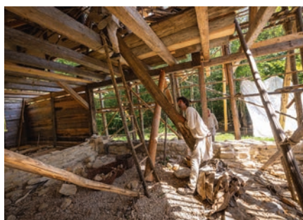
Auf der Baustelle des Campus Galli.

mit Dr. Hannes Napierala (Campus Galli, Verein „karolingische Klosterstadt e. V.“)